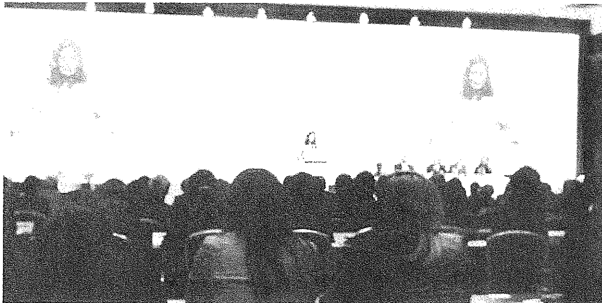
Laura Boldrini, Presidenta del Parlamento Italiano

Ante la necesidad de reformar los sistemas políticos, dijo que deben integrarse al Consejo, la Corte y Consejo de Europa, en busca de devolver la confianza a los ciudadanos con instrumentos que usamos de la mejor manera.