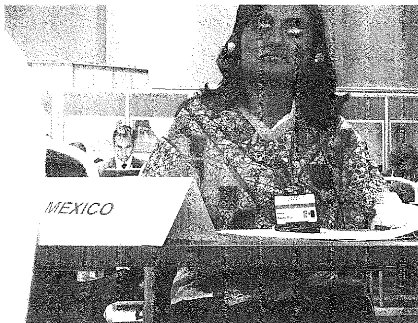
Durante una de las sesiones de Asamblea Parlamentaria del Consejo de Europa (PACE)

Ciertas delegaciones, como la de Islandia, se refirieron al papel que debe jugar la OTAN en este contexto. Otros oradores, abordan situaciones particulares que contribuyen a aumentar la inseguridad en Europa como el fortalecimiento de partidos populistas y el resurgimiento de los nacionalismos lo que muchas veces se traduce en actitudes xenofóbicas. Para evitar estas situaciones se reconoció la importancia que juega la participación democrática.