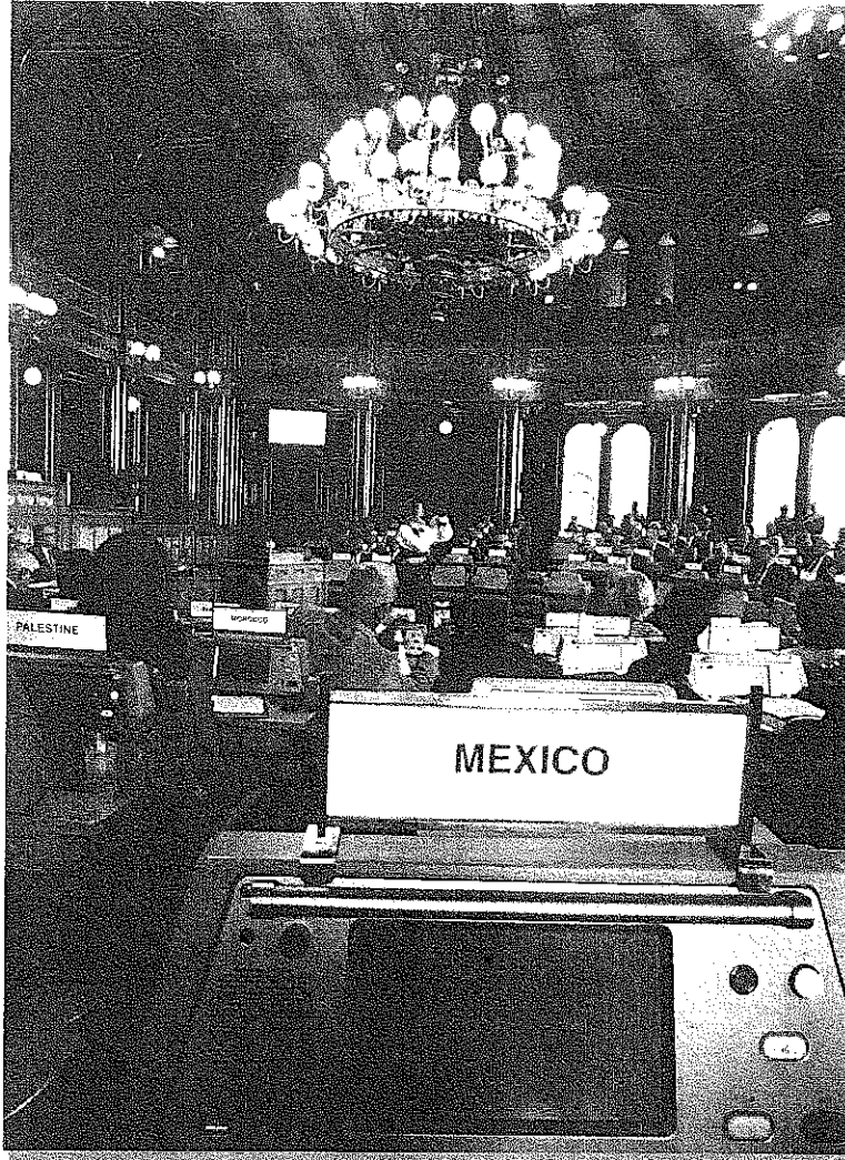
La sede del Parlamento Noruego albergó los trabajos de la Asamblea Parlamentaria del Consejo de Europa (PACE)