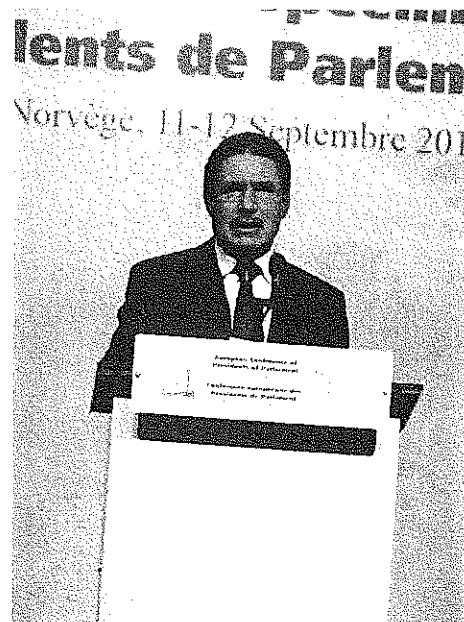
Senador José Rosas Aispuro Torres

El senador José Rosas Aispuro Torres, vicepresidente de la Mesa Directiva del Senado de México, realizó una intervención en la cual se refirió a la reciente Reforma Política, destacando la inclusión de la Consulta Popular. De igual manera se refirió a los espacios que los mecanismos parlamentarios conceden a las minorías y a la necesidad de que los organismos internacionales, particularmente las instituciones, amplíen sus mecanismos de participación.